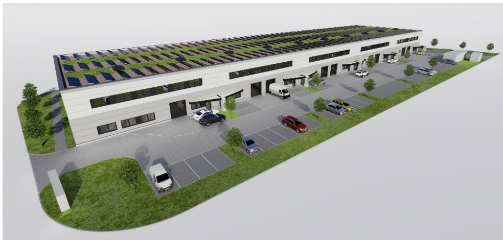
Geplanter VarioPark in Nackenheim, Karolingerstraße 3, Gewerbegebiet „Am Wäldchen“